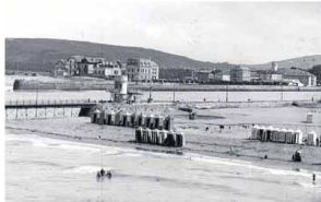
Foto del 2 enero 1890, ya construido el muelle de hierro, ubicado a la izquierda al lado de la estima playa de Portugalete que hace hasta casetas. Al fondo, chaberto de Las Arenas.

ejemplo, Fiat, la única empresa dedicada hasta hace unos pocos años a la fotografía aérea en Bizkaia, ha sido proveedor habitual del Puerto de Bilbao. La sucesión de instalaciones año tras año permite ver cómo ha evolucionado a posición la metrópoli bizkaína. Para nuestra sociedad de reglas y limpieza sorprende cómo hace apenas unas décadas se descargaba mercancías en pleno Arsenal y la gente, los perros, incluso los niños pasaban al lado de accesorios a la línea de araque sin problemas. Nada que ver con las imágenes actuales del puerto en el Abra Exterior, donde