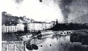
Desde se colocó la tomas de Aste Nagusia, en 1874 existían rampas y muros cerrados. La imagen está tomada durante un bombardeo en la III Guerra Carlista.