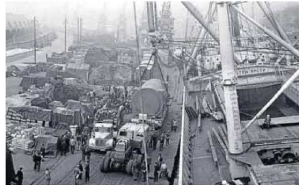
La imagen no tiene fecha, se calcula los años 50, y se observa la febril actividad de descarga de grandes motores en los muelles donde ahora se levanta el Guggenheim.