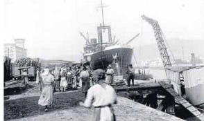
El 6 de agosto de 1924, el mercante Mar Adriático descarga madera en el muelle de Zorrotra, época en la que ya era permitido el trabajo portuario a las mujeres.